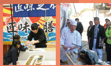
◆幼稚園の謝恩会で ◆鮭解体実演