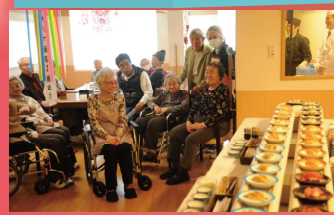
◆介護施設でのイベント食で

これぞ究極の「食べフェス」イベント型ケータリング 本格回転寿司と高級屋台寿司の出張サービス