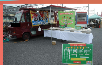
◆業界初! キッカー回転寿司出店