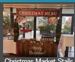
Christmas Market Stalls