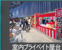
室内プライベート屋台