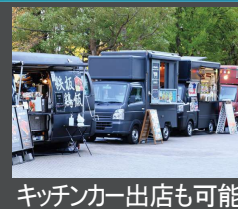
キッチンカー出店も可能