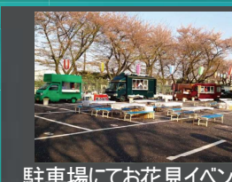
駐車場にてお花見イベント